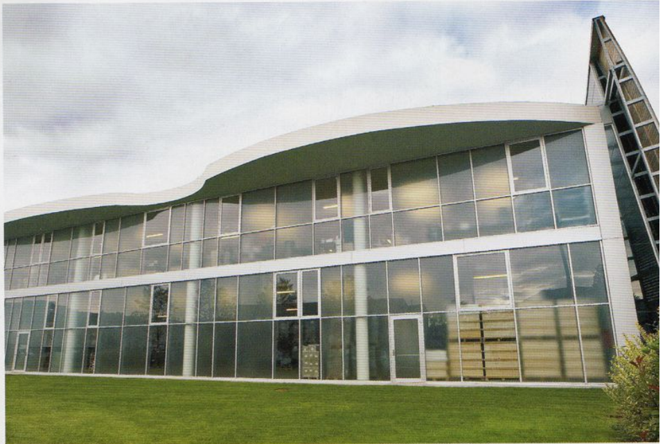
Geschwungen: Das Firmengebäude nimmt die eleganten Rundungen auf.

Zu den erstaunlichen Konstruktionsmerkmalen gehört ein zusätzlicher Diffusstrahler auf der Rückseite, mit der sich der im Raum verteilte indirekte Schall in