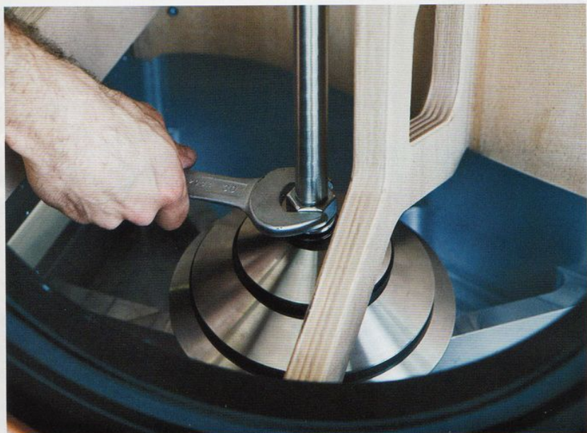
Die Größte heißt schlicht „The Sonus Faber“ und inspirierte die Futura.

zwischen zwei aus dem Vollen gefrästen Aluminium-Elementen nebst mittiger Verbindungsstrebe und massiver Schallwandeinfassung umfasst. Die letzten beiden Konstruktionsmerkmale finden sich in der Futura auch – sie trägt eindeutig die Gene des absoluten Spitzenmodells. <